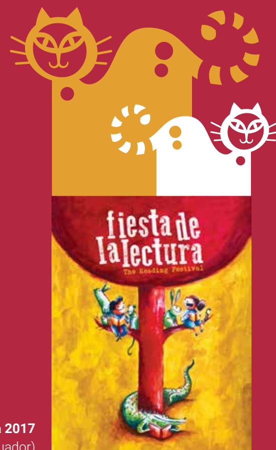
Cartel oficial de la Fiesta de la Lectura 2017 Ilustración y diseño: Roger Ycaza (Ecuador)

Para la Fundación Cuatrogatos es motivo de gran satisfacción que el cartel promocional de esta fiesta de la literatura, los libros y las artes en español haya sido creado por el reconocido ilustrador y diseñador ecuatoriano Roger Ycaza.